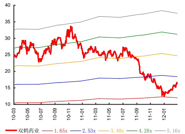
图表 3：双鹤药业历史 PB Band